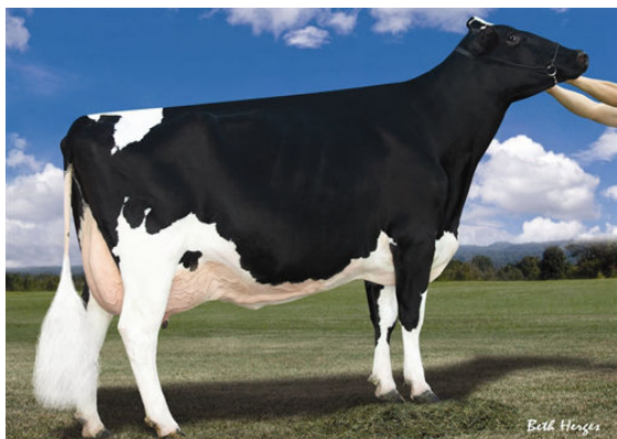
RALMA GOLDWYN CARMEL GRANDDAM